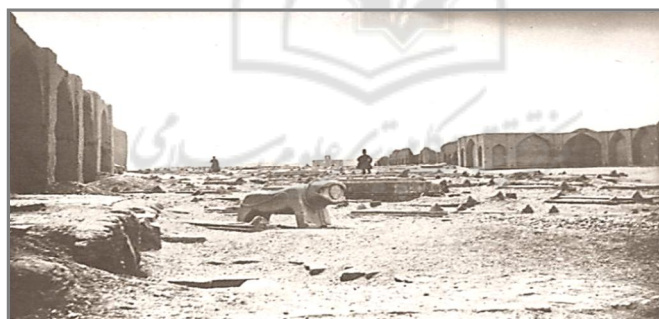
تصویر (۱): تخت فولاد در دوره قاجار - ارنست هولستر، کتاب هزار جلوه زندگی

در عهد سلطان سلیمان و با وفات میرزا رفیعا نائینی (۱۰۸۲ ق) و آقا حسین خوانساری (۱۰۹۸ ق) و احداث بقاع زیبا که از لحاظ معماری و تزئینات از بهترین نمونه های فاخر می باشد، تخت فولاد باز هم گسترش یافت. تضعیف دولت صفوی از لحاظ سیاسی و اقتصادی در عهد شاه سلطان حسین مانع از گسترش تخت فولاد و احداث بقاع بر مزار علمای دینی نشد، چنان که در این ایام نیز تکاپایی همچون «فاضل سراب»، «خاتون آبادی»، «ملا اسماعیل خواجهی» و «آقارضی» شکل گرفتند و به تخت فولاد وسعت بیشتری بخشیدند. با همه این ساخت و سازها، هنوز زمان زیادی تا اتصال نهایی تخت فولاد به کالبد شهری اصفهان باقی مانده بود. حمله افغانه به سال ۱۱۳۵ ق باعث تخریب و ویرانی تکاپای متعدد این آرامگاه شد و بسیاری از مصالح و سنگ مزارات آن برای حصار که اشرف افغان ساخته بود به کار رفت. در دوره افشاریه و زندیه توجه زیادی به تخت فولاد نشد و به جز چند بقعه و چهارتاقی از جمله «بقعه فیض علیشاه» بنای چندان مهمی در آن تأسیس نگردید. آن گونه که از متون تاریخی برمی آید، تخت فولاد در اوایل حکومت فتحعلیشاه قاجار، روستایی کوچک با جمعیتی اندک بود و گورستان آن همچنان در خارج از برج و باروی اصفهان قرار داشت. (تصویر ۱)